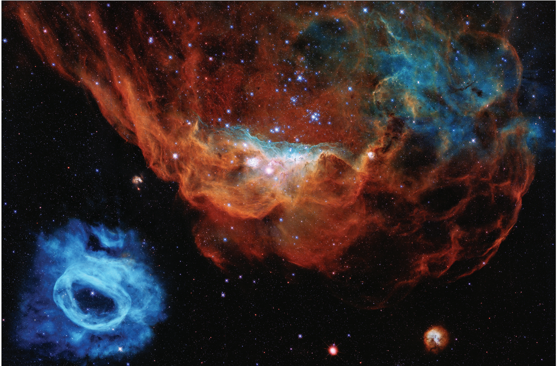
NGC 2014 y NGC 2020